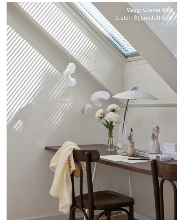
Vägg: Creme 587 Lister: Stjärnstoft 526

Addera struktur. Skapa ditt eget konstverk av överblivet spackel och rester från kulörprover. Det ger en personlig och harmoniskt touch till rummet.