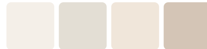
Äggskal 524 0601-Y14R