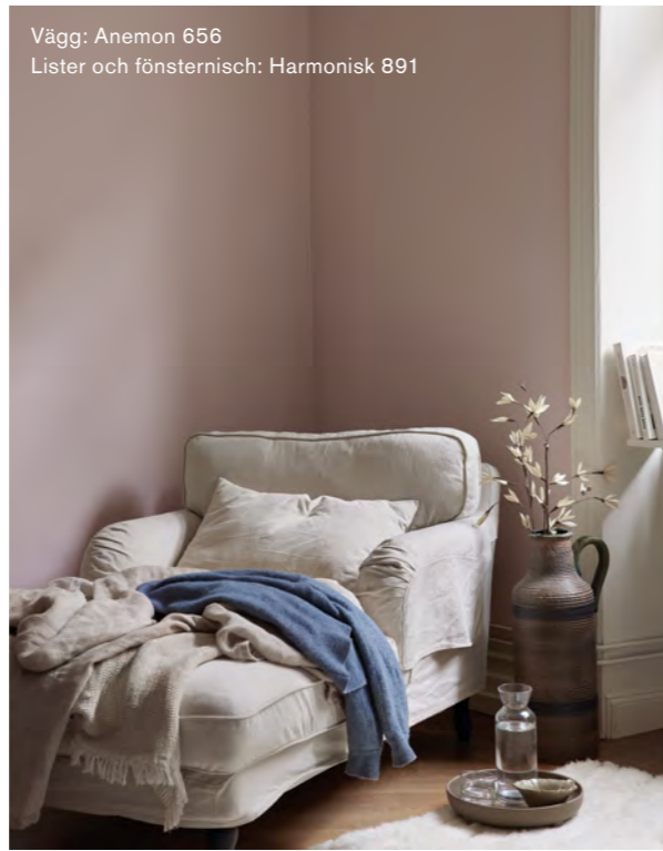
Vägg: Anemon 656 Lister och fönsternisch: Harmonisk 891