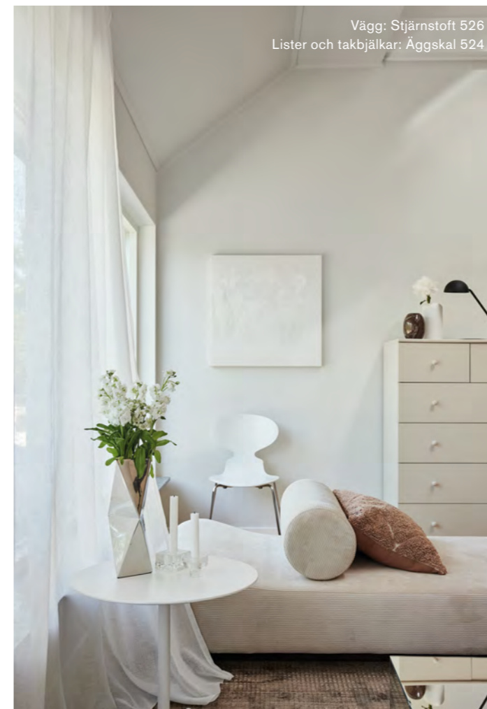
Vägg: Stjärnstoft 526 Lister och takbjälkar: Äggskal 524