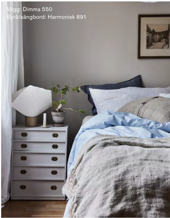
Vägg: Dimma 550 Byrå/sängbord: Harmonisk 891