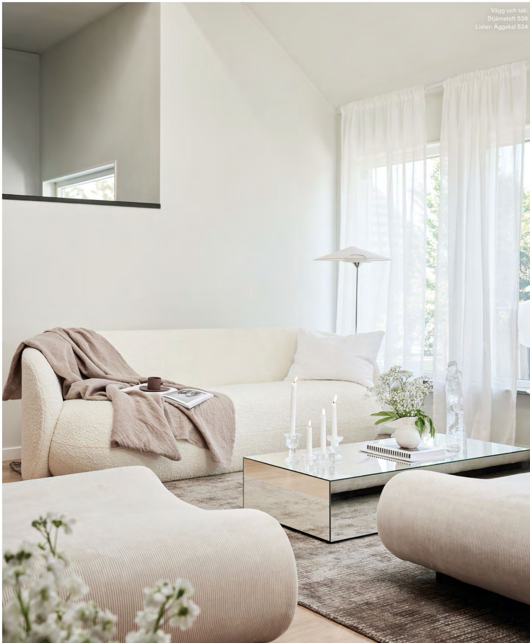
Vägg och tak: Stjärnstoft 526 Lister: Äggskal 524