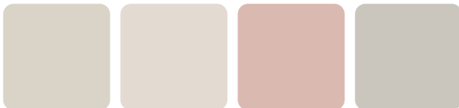
Dimma 550 S 2002-Y50R Camee 651 S 1002-Y50R Anemon 656 2007-Y72R Vinternatt 507 S 2002-Y