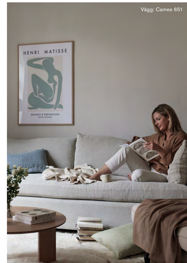
Vägg: Camee 651