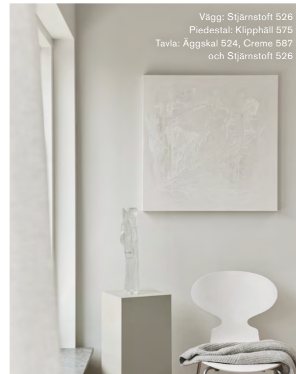
Vägg: Stjärnstoft 526 Piedestal: Klipphäll 575 Tavla: Äggskal 524, Creme 587 och Stjärnstoft 526